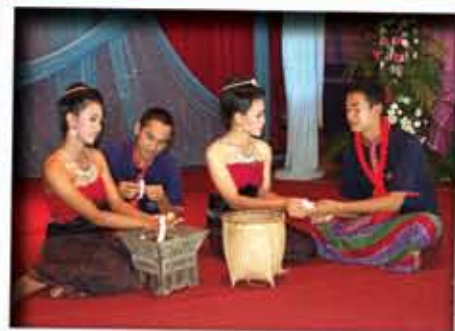
วัฒนธรรมผู้ไทย