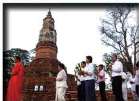
เมืองฟ้าแดดสงยาง