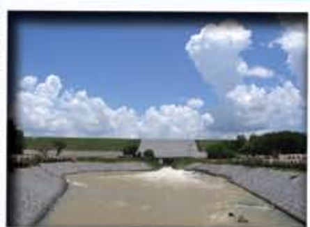
มหาธารลำปาว