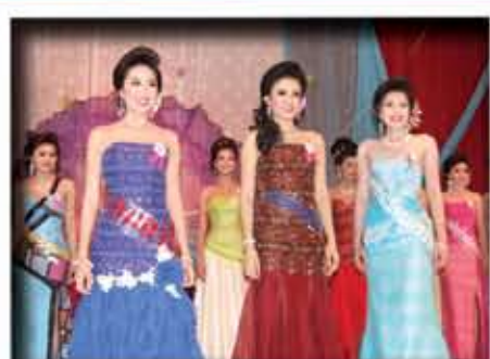
ผ้าไหมแพรวา