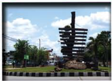
โป่งกลางเลิศจ้ำ