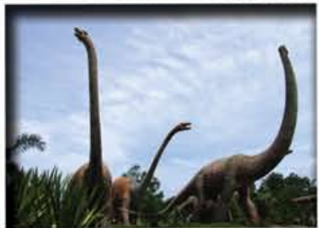
ไดโนเสาร์สี่ตัวโลกล้านปี