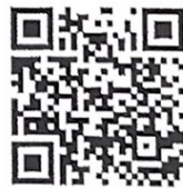
สแกน QR Code สมัครอบรม