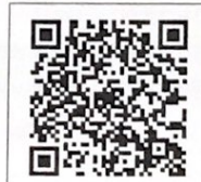
QR-Code เพื่อสอบถาม