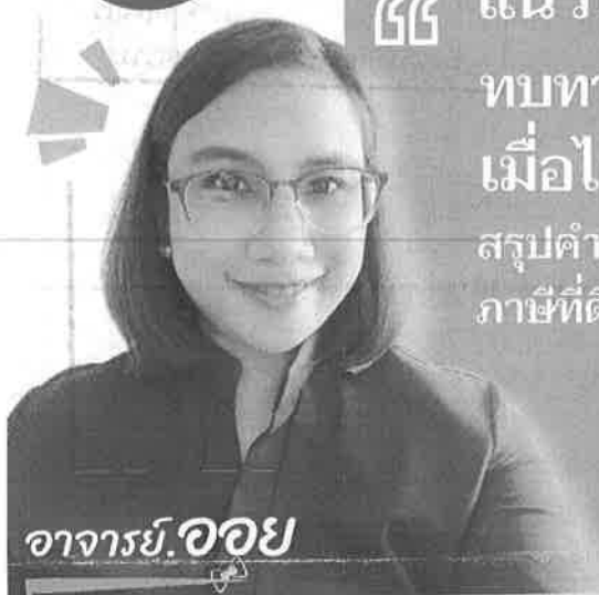
อาจารย์.ออย

เทคนิคการปรับปรุงข้อมูลในระบบ โปรแกรมแผนที่ภาษี และทะเบียนสินทรัพย์