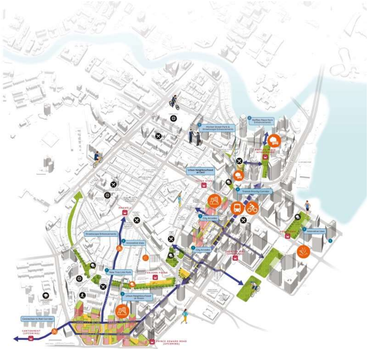
ภาพการเชื่อมต่อกิจกรรมต่าง ๆ ในย่าน downtown/ผู้แปล