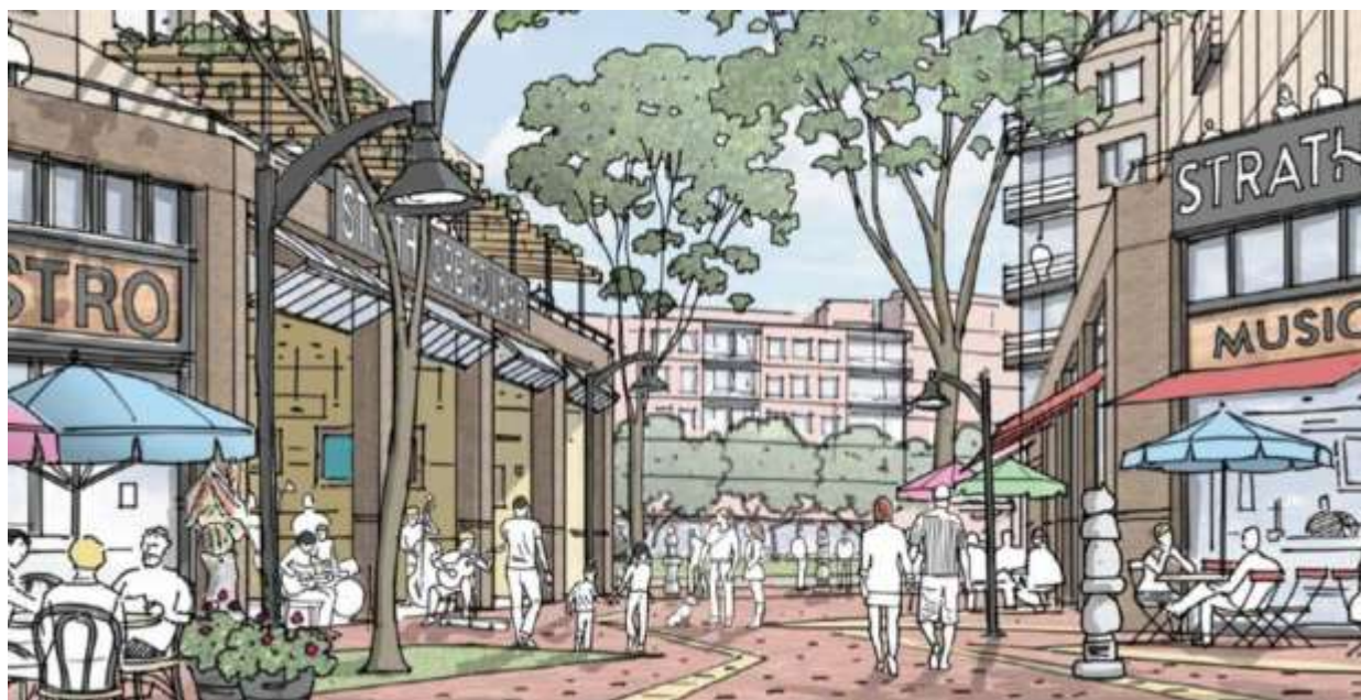
Strathmore Square.