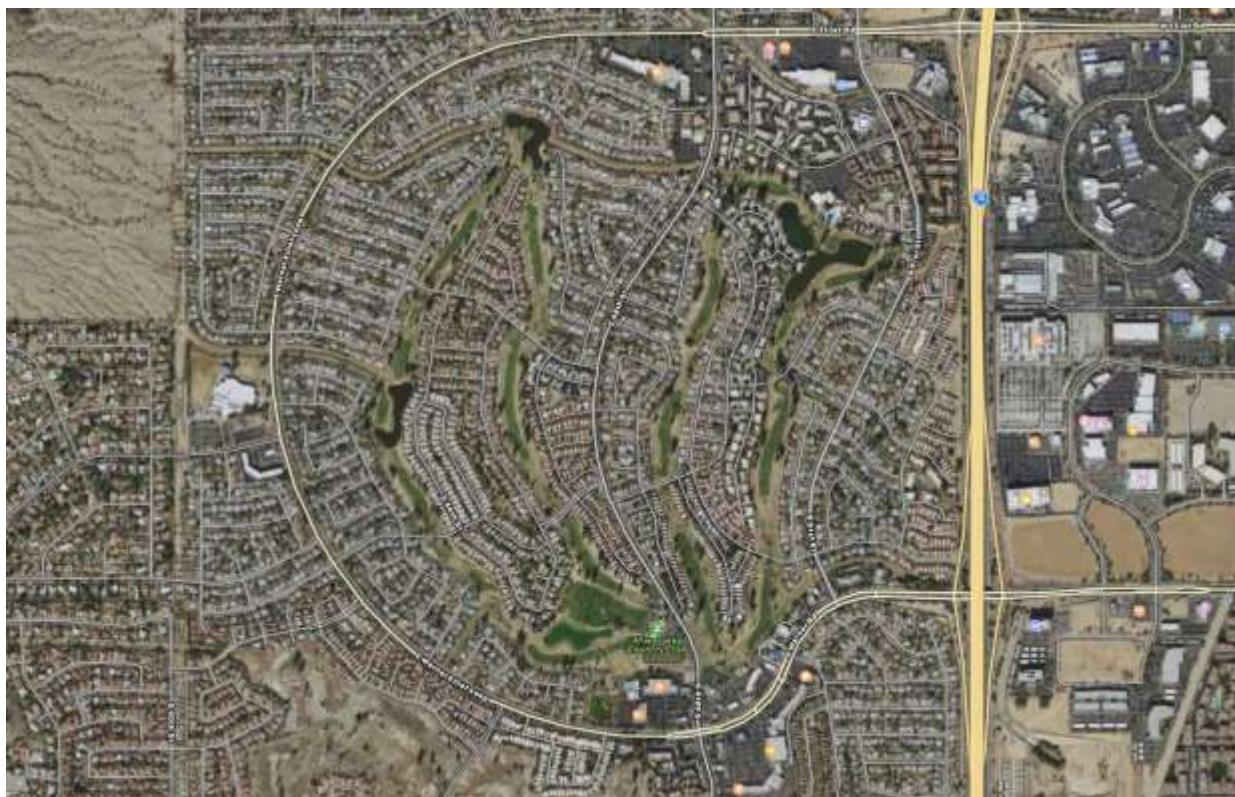
ที่พักอาศัยในย่านสนามกอล์ฟ