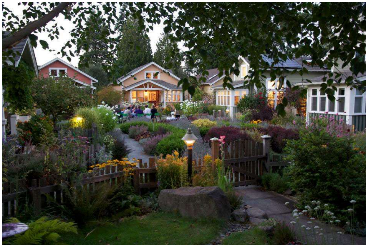
Greenwood Avenue cottages ในเมือง Shoreline, Washington.