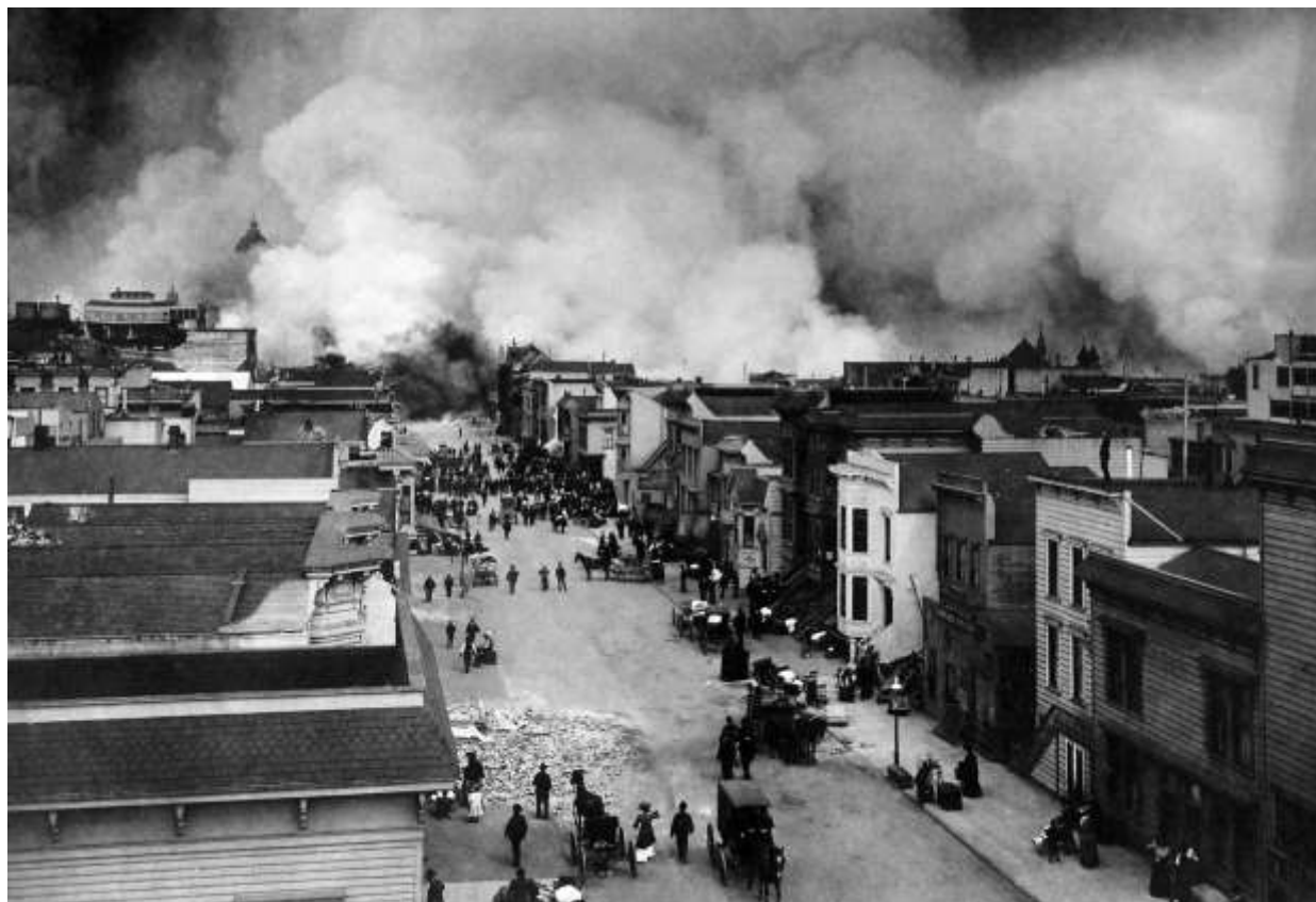
ภาพเหตุการณ์แผ่นดินไหวที่ซานฟรานซิสโก