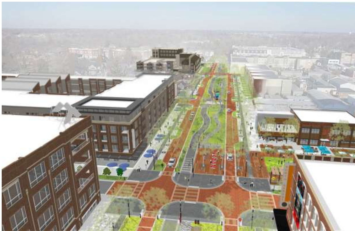
ภาพการออกแบบพื้นที่ Monon Boulevard