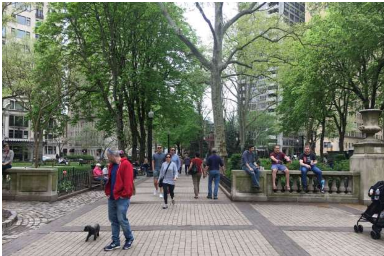
Rittenhouse Square ใน Philadelphia. ภาพโดย Robert Steuteville.