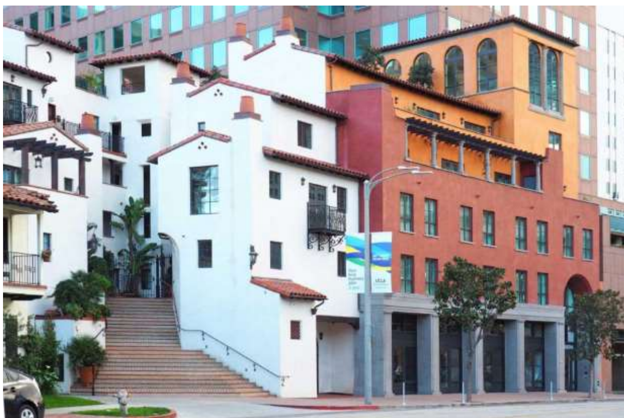
Plaza La Reina ในลอสแอนเจลิสเป็นโรงแรมที่มีร้านค้าปลีกในชั้นที่หนึ่ง บันไดทางขึ้นที่ใหญ่โต และมีลานกว้างในชั้นสอง ออกแบบโดย Moule & Polyzoides

การออกแบบทางสถาปัตยกรรมที่ทำให้เมืองเป็นอันดับแรก การออกแบบทางสถาปัตยกรรมที่มุ่งแข่งขันเพื่อดึงดูดความสนใจมากเกินไป เช่น สถาปัตยกรรมเชิงประติมากรรม แต่สถาปัตยกรรมที่ดีที่สุดเปรียบเสมือนวงซิมโฟนีที่ทำงานร่วมกันกับทุกอย่างที่อยู่รอบตัวเพื่อสร้างสรรค์ดนตรีที่สวยงาม ส่วนหนึ่งของดนตรีก็คือช่องว่างระหว่างอาคารเพราะนั่นคือบริเวณที่ผู้คนในชุมชนเมืองจะได้พบปะกัน ก็คือพื้นที่สาธารณะนั่นเอง สถาปัตยกรรมมีหน้าที่ที่จะต้องสร้างพื้นที่สาธารณะให้ดีกว่าเดิม ซึ่งสามารถทำได้ง่ายๆโดยการทำระเบียงหน้าบ้านแทนที่จะทำประตูโรงรถ นี่เป็นเป้าหมายสำคัญสำหรับนักสถาปัตยกรรมและนักผังเมืองที่จะทำให้พื้นที่สาธารณะดีขึ้น