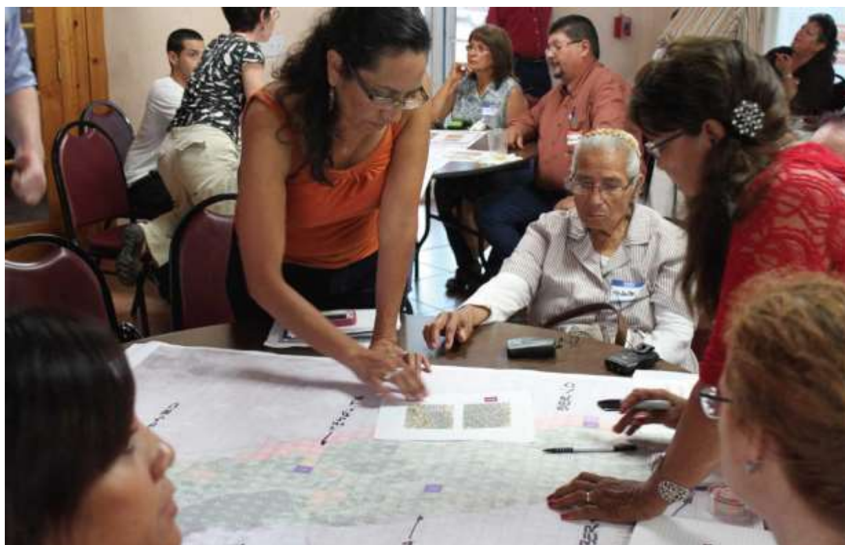
การจัดกลุ่มระดมสมอง (Charrette) ในเขต Las Cruces, Dona Ana County รัฐ New Mexico ในปี 2016

การจัดกลุ่มระดมสมอง/ผู้แปล (charrette) เพื่อให้ได้ชุมชนหรือสังคมที่สมบูรณ์ คุณต้องมีกระบวนการที่สมบูรณ์ และนั่นก็คือ charrette (หรือการจัดกลุ่มระดมสมอง) สิ่งที่ดีที่สุดก็คือการนำผู้มีส่วนได้เสียทั้งหมดทุกระดับชนชั้นมาร่วมอยู่ในกระบวนการ มันจะทำให้ลดเวลาในการออกแบบน้อยลง การตัดสินใจใดๆในผลประโยชน์จะถูกแก้ไขภายใต้การกดดันของเส้นตายที่ตั้งไว้ การระดมสมองเน้นให้ความสำคัญเรื่องความรู้สึกของคนเป็นหลัก