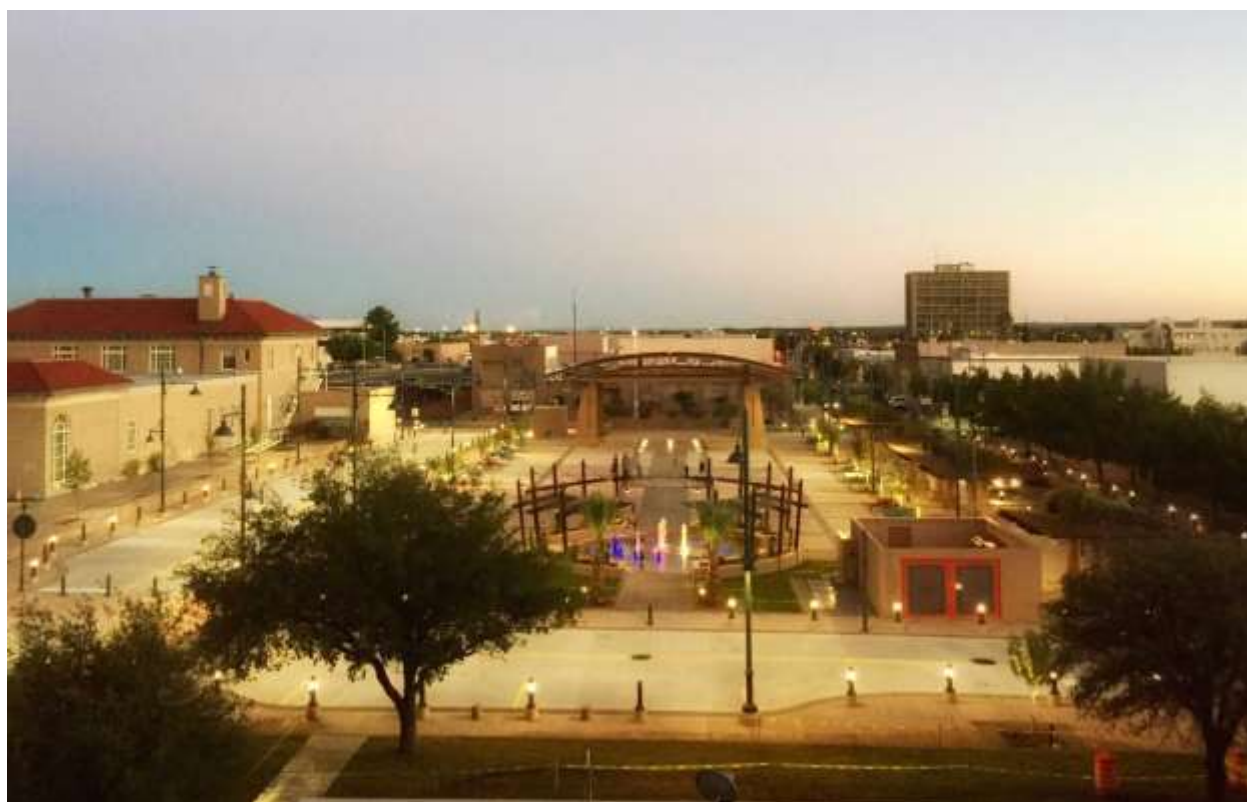
ตลาดสินค้าที่ตั้งอยู่บนถนนสายหลักในเขต Las Cruces, Dona Ana County รัฐ New Mexico

ตลาดสินค้ากลางตามภูมิภาคต่างๆ (The polycentric region) เป็นโครงสร้างพิเศษของการผังเมืองที่ดี แนวคิดนี้จินตนาการถึงการสนับสนุนทุกชุมชนทุกพื้นที่ เช่น หมู่บ้านเล็กๆ หมู่บ้านใหญ่ เมืองเล็กๆ เมืองใหญ่ ชุมชน และเมืองต่างๆ เชื่อมโยงกันด้วยระบบโครงข่ายคมนาคม ตลาดสินค้ากลางตามภูมิภาคจะเชื่อมโยงพาร์มไป ยังโต๊ะอาหาร ธรรมชาติสู่ใจกลางเมือง บ้านเรือนสู่ที่ทำงาน และทำให้ผู้คนสามารถเดินทางจากเมืองหนึ่งไปยังอีก เมืองหนึ่ง ชุมชนหนึ่งไปยังอีกชุมชนหนึ่งได้