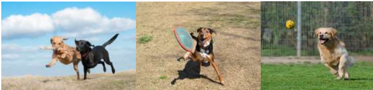
ภาพประกอบ pop-up dog park

36. วางแผนทำ pop-up dog park หากชุมชนของคุณไม่มีสถานที่สำหรับให้สุนัขวิ่งเล่น ไม่มีพื้นที่ว่างพอสำหรับกีฬาฟันดาบแม่เพียงเล็กน้อยที่จะจัดสรรได้ สวน pop-up dog ได้กลายเป็นส่วนหนึ่งของตลาดเกษตรกรรายสัปดาห์ในเมืองซาคราเมนโต มันได้รับความนิยมจนกลายเป็นแรงบันดาลใจในการทำงานสิ่งปลูกสร้างให้กับสุนัขในพื้นที่ใกล้เคียง