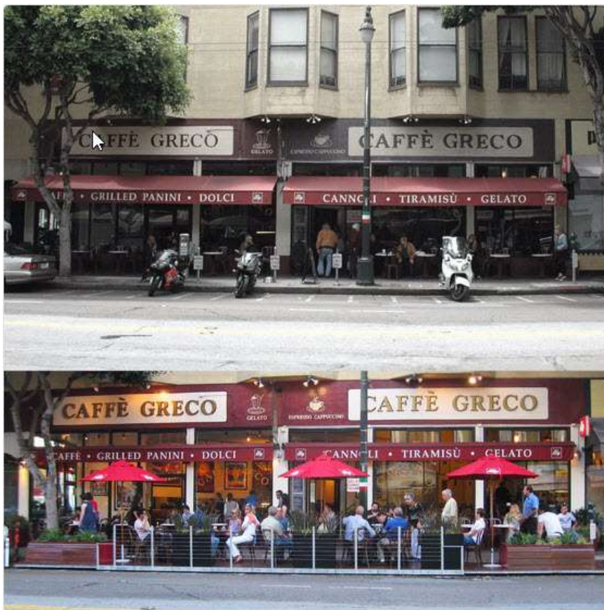
ภาพโครงการ Pavement to Park ปรับทางเท้าให้เป็นสวนจาก

38. เปลี่ยนที่จอดรถให้เป็นสวน ถนนที่วุ่นวายสามารถเป็นได้มากกว่าเพื่อรถราที่ยุ่ง นี่เป็นแนวคิดเบื้องหลังวันจอดรถได้ เป็นวันที่สำคัญทั่วโลกที่กระตุ้นให้ศิลปินและนักออกแบบมาเปลี่ยนเครื่องวัดที่จอดรถเป็นงานปฏิมากรรมของชุมชน แนวคิดนี้กลายมาเป็นนโยบายของเมืองไป โครงการปรับทางเท้าเป็นสวนทำให้ผู้สนับสนุนในซานฟรานซิสโกได้ทดสอบโครงการที่คล้ายๆกันและเปลี่ยนให้เป็นพื้นที่สาธารณะในที่สุด