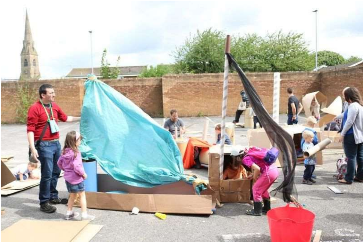
Pop-Up Adventure Play