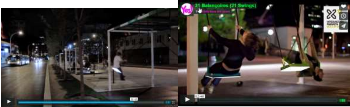
ภาพโครงการ 21 Swings project

36. วางแผนทำ pop-up dog park หากชุมชนของคุณไม่มีสถานที่สำหรับให้สุนัขวิ่งเล่น ไม่มีพื้นที่ว่างพอสำหรับกีฬาฟันดาบแม่เพียงเล็กน้อยที่จะจัดสรรได้ สวน pop-up dog ได้กลายเป็นส่วนหนึ่งของตลาดเกษตรกรรายสัปดาห์ในเมืองซาคราเมนโต มันได้รับความนิยมจนกลายเป็นแรงบันดาลใจในการทำงานสิ่งปลูกสร้างให้กับสุนัขในพื้นที่ใกล้เคียง