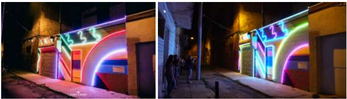
ภาพจิตรกรรมฝาผนังไฟนีออน "neon mural" /ผู้แปล

12. สู้กับอาชญากรรมด้วยไฟนีออน โดยเฉพาะอย่างยิ่งการปล้นเพื่อชิงเงินสดในเมือง ไฟถนนในพื้นที่ที่มีความสำคัญต่ำซึ่งมีการลงทุนติดตั้งบำรุงรักษาราคาแพง แต่ได้รับการพิสูจน์แล้วในการยับยั้งการเกิดอาชญากรรมได้ด้วย ศิลปินชาวฟิลาเดลเฟีย 2 คนได้ทำให้บล็อกอันตรายเป็นอย่าง South Philly สว่างไสวขึ้นด้วย "neon mural." งานศิลปะส่องสว่างได้กลายเป็นจุดหมายปลายทางตอนค่ำของชาวโซเซียลมีเดีย การได้เห็นถนนในช่วงเวลานี้กลายเป็นที่ต้องการในชุมชนมากที่สุดด้วย