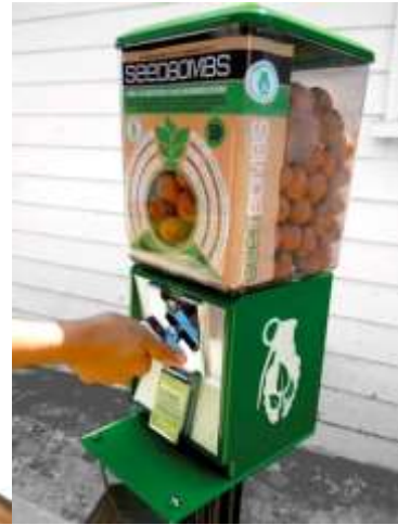
ภาพประกอบ "seedbomb"