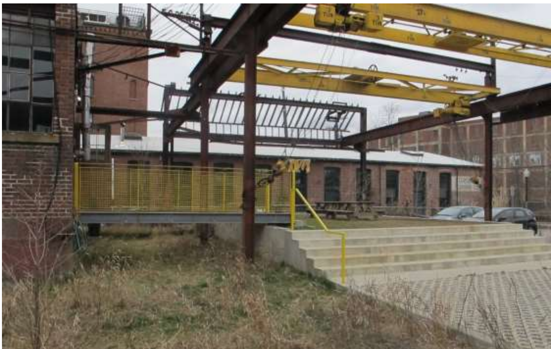
The steel yard