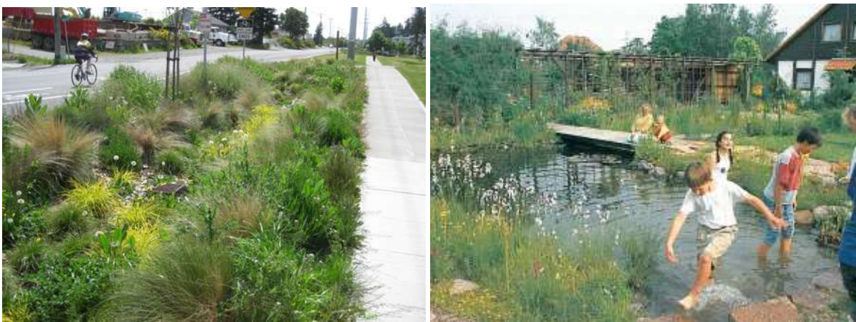
ภาพประกอบ stormwater garden จาก Google/ผู้แปล