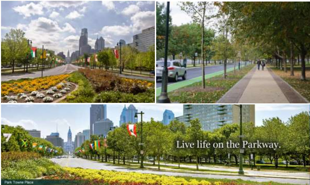
ภาพประกอบ parkway จาก Google/ผู้แปล

2. ทำให้ parkway (ถนนกว้างที่มีแนวต้นไม้อยู่ตรงเกาะกลางถนน) เป็นถนนสีเขียว เอาหละ มีสถานที่มากมายที่ต้องต่อสู้ให้ผ่านพ้นกับปัญหานี้ คุณก็รู้ว่าไม้เศษไม้เศษวัสดุสิ่งของมากมายที่อยู่ระหว่างทางเข้ากับขอบถนน ไม่ว่าจะคุณจะเรียกมันว่าอะไร แทนสิ่งเหล่านั้นด้วย stormwater garden ที่ซึ่งน้ำธรรมชาติสามารถไหลซึมลงสู่พื้นดินได้